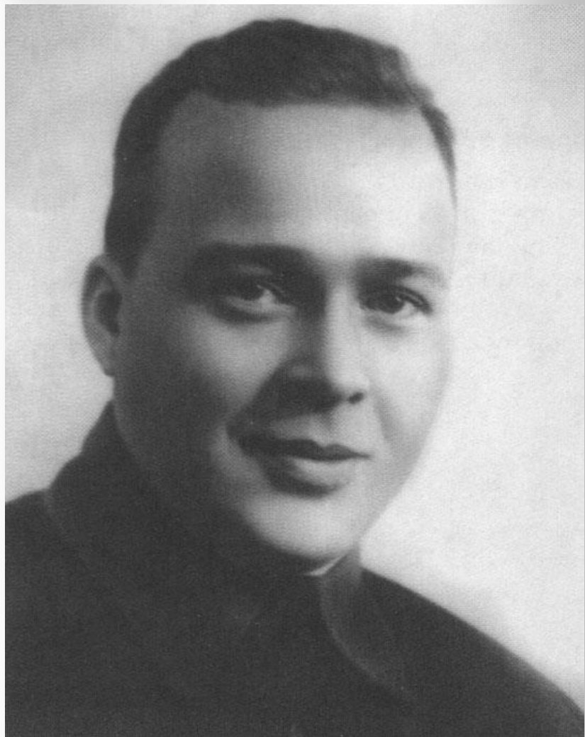
А.П. Гайдар (1904-1941)